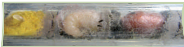
Pollenbrot mit Ei – Larve – Puppe

Nach 3 bis 6 Tagen schlüpft bei den meisten Arten aus dem Ei die Larve. Diese ernährt sich vom Pollenbrot, welches ihr das Muttertier zuvor in die Nistkammer legte. Die Larve entwickelt sich wohlgenährt über mehrere Stadien und überwintert meist als Puppe oder Imago. Im darauffolgenden Frühling gräbt sie sich durch die Nestverschlüsse. Erst fliegen die Männchen aus, die nicht selten auf die später folgenden Weibchen warten, um sich sogleich zu paaren.