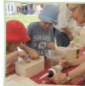
Bausätze sind gut geeignet

Wenn Sie gerne Wildbienen beobachten, sind Nisthilfen eine geeignete Möglichkeit, dies zu tun. Sie können diese mit geringem Zeit- und Kostenaufwand selber bauen. Oberirdisch nistende Wildbienen brauchen dafür vor allem vier Dinge: Bruträume mit geeignetem Durchmesser, einen Regen-