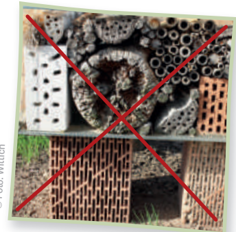
So bitte nicht