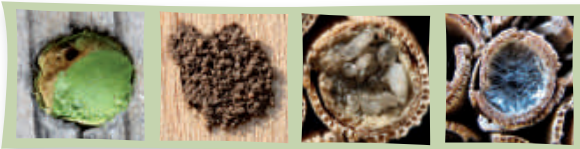
Blattschneiderbiene Mauerbiene Scherenbiene Maskenbiene