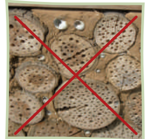
Bohren Sie nicht ins Stirnholz!

Achten Sie besonders darauf, scharfe Werkzeuge zu nutzen, sorgfältig zu bohren und die Späne aus den Löchern zu entfernen. Benutzen Sie Holzbohrer verschiedener Durchmesser (2 bis 9 Millimeter) und schaffen Sie etwa 10 Zentimeter tiefe Löcher, gerne auch tiefer.