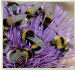
Erdhummeln auf Distelblüte

Sie müssen aus Ihrem Garten keine Wildnis und kein Naturschutzgebiet machen, damit es den Bienen gefällt! Die kleinen Summer freuen sich schon, wenn Sie neben Ziergewächsen auch heimische Stauden und Gehölze pflanzen. Es ist oft leichter als Sie glauben!