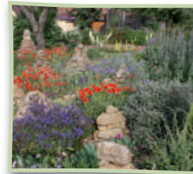
Artenreicher heimischer Steingarten ist eine Wohltat.

Wo wir auch hinsehen entdecken wir nordamerikanische Thuja, asiatischen Bambus oder hochgezüchtete Sorten von Geranien, Stiefmütterchen und dergleichen. Dabei sind in Deutschland über 4.000 Pflanzenarten heimisch! Nur etwa 60 davon werden regelmäßig in Gartencentern angeboten. Durch diese Eintönigkeit vergessen wir mehr und mehr, wie wunderschön unsere Natur gleich vor der Haustür sein kann.